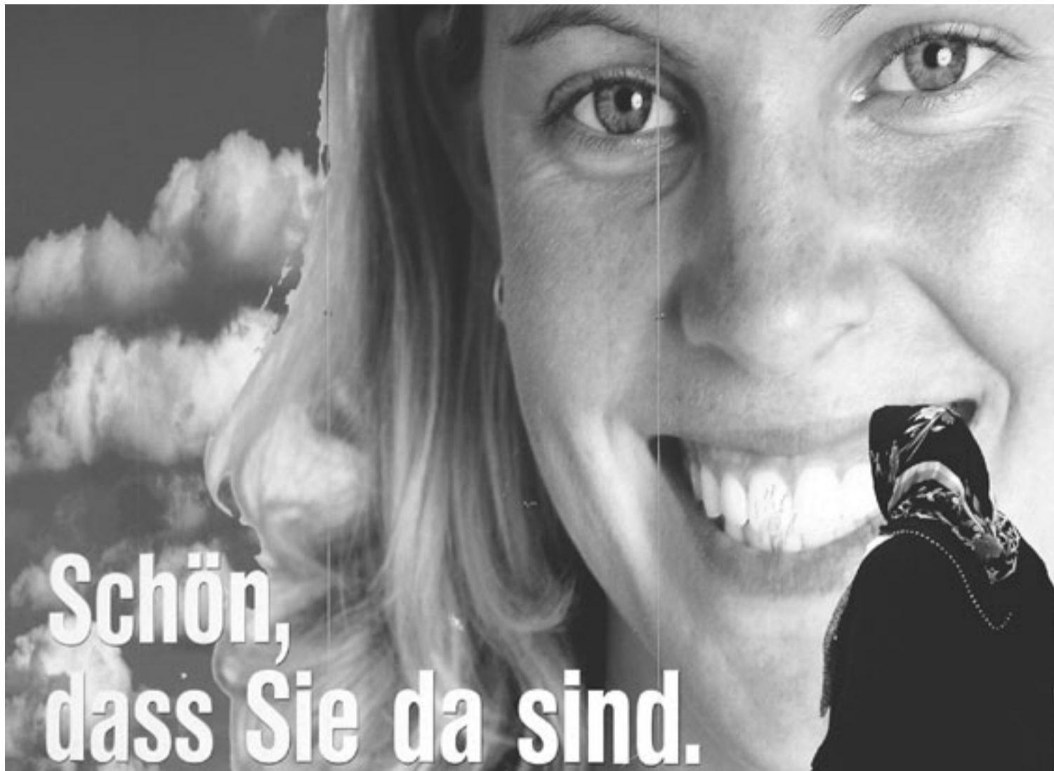
„Schön, dass Sie da sind“, lautete das Motto einer Aktion zur Integration. Migranten bringen zuweilen Probleme mit, aber auch Potenzial.

Die Förderung von Kleinkindern ist sinnvoll. Das gilt gerade für Kinder, die in ihrer